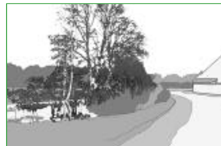
9. Les mares Très présentes dans le Perche, les mares permettent de récupérer les eaux de ruissellement. Elles s'accompagnent d'une végétation spécifique (saules, aulnes, frênes...).