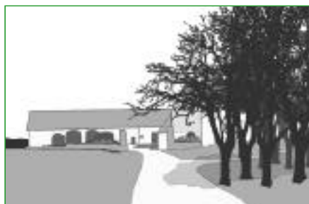
1. Le bosquet Planté le long du chemin d'accès ou dans un jardin, le bosquet apporte de l'ombre. Il joue un rôle de repère visuel.

Si l'on regarde attentivement les paysages du Perche, il existe une grande diversité de formes végétales. L'arbre et l'arbuste s'associent. Les compositions végétales, les lieux d'implantation et les modes d'entretien varient. Cette diversité de formes agrmente de mille façons les abords de la maison, car elle participe à la richesse de nos paysages.