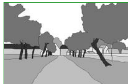
3. L'alignement Simple ou double, l'alignement de fruitiers est planté le long des chemins. Il marque l'accès aux fermes.