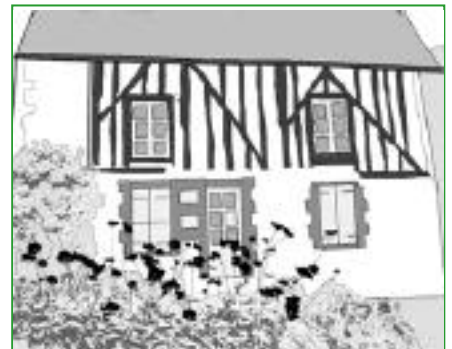
18. Le fleurissement Les fleurs évoquent le jardin et apportent de la couleur. Elles permettent de mettre en valeur et de délimiter un espace. (rosiers anciens, vivaces, annuelles).