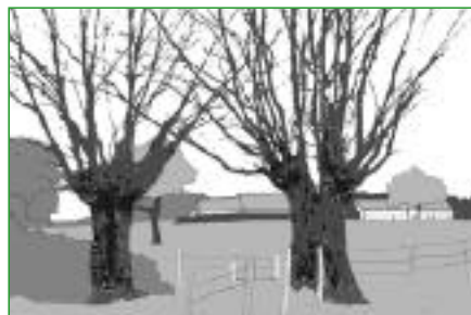
8. Les têtards Les arbres taillés en têtard (saules, frênes, chênes...) sont éêtés régulièrement pour la production de fagot. Leur tronc, souvent creux, est un bon nichoir pour la faune.