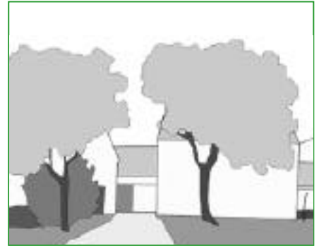
12. La porte végétale La porte végétale marque une entrée. Elle crée un effet de voûte qui invite à franchir le passage.