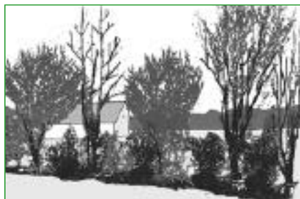
7. Les haies brise-vent Orientées perpendiculairement aux vents dominants, les haies brise-vent protègent un bâtiment, un jardin ou une parcelle sur une distance de 20 fois leur hauteur.