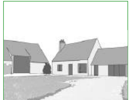
15. La pelouse Dans une cour, la pelouse (comportant de la fétuque) permet de maintenir un espace ouvert, de délimiter l'emprise des circulations et mettre en valeur une ambiance minérale en évitant le revêtement en asphalte et l'utilisation de désherbants.