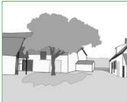
14. L'arbre isolé L'arbre isolé capte le regard et apporte de l'ombre dans le jardin ou dans la cour. Le volume végétal équilibre l'ensemble des bâtiments.