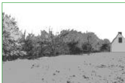
4. Les haies arbustives Elles permettent de délimiter un espace ou de masquer une vue. Plantées avec des espèces adaptées, elles sont un lieu d'alimentation, de refuge et de reproduction pour la faune sauvage. Les haies de noisetiers étaient très présentes dans le Perche.