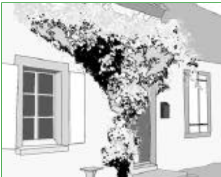
16. Les plantes grimpantes Les plantes grimpantes peuvent être utilisées pour habiller un mur, une façade ou sur une pergola (chèvrefeuille des bois, clématite vigne blanche...).