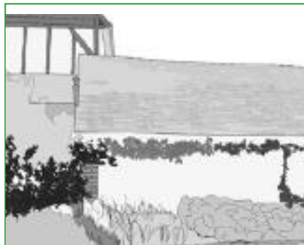
17. Les arbres palissés Les fruitiers (poiriers ou pommiers) peuvent être palissés sur les façades ensoleillées, dans le jardin potager ou dans la cour.