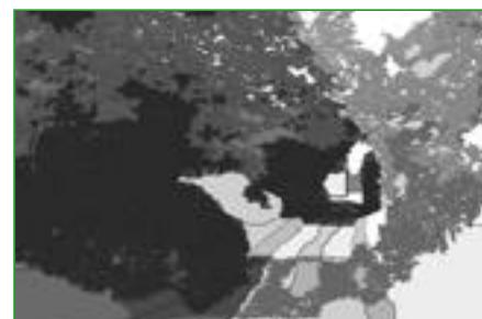
6. Les voûtes végétales des chemins creux Les chemins creux plantés forment un tunnel de verdure ombragé. Ils constituent une des caractéristiques des paysages du Perche.