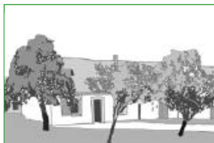
5. Le verger Le verger hautes tiges est présent autour de nombreuses maisons percheronnes. Il permet d'occuper très simplement les abords de la maison et d'y cueillir des fruits.