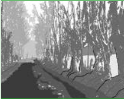
10. La haie sur talus Positionnée perpendiculairement à la pente, elle est très efficace contre l'érosion des sols.