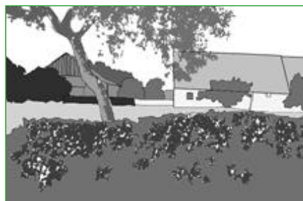
2. La haie basse et les arbres de haut jet Dans cette association, la haie basse clôture l'espace, l'arbre rompt la continuité de la haie, apporte de l'ombre, ... et des fruits s'il s'agit d'arbres fruitiers.