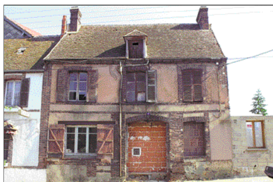
Solutions à éviter