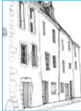
Maisons de centre-bourg