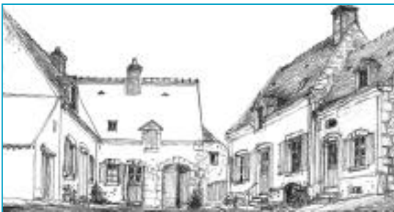
Maisons sur cour commune