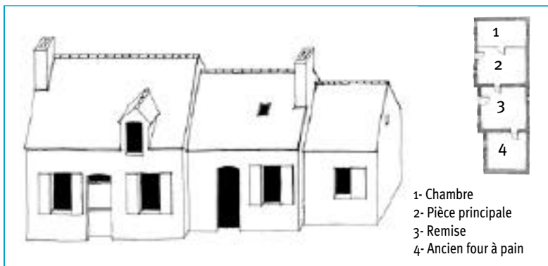
Type 4 : la maison fermière

En contrepartie, la longère est rarement associée à d'autres bâtiments, ce qui la différencie dans ses dispositions topologiques (dimension de la parcelle et positionnement de la construction) de la ferme à cour.