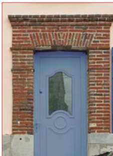
Exemple satisfaisant de l'entretien d'une maçonnerie en brique. Les couleurs et textures des nouveaux joints ou des briques remplacées sont identiques aux anciennes.