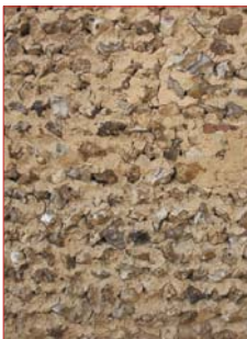
Maçonnerie en silex.