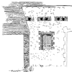
Maçonnerie mixte, enduit et brique : - tuiles plates en terre cuite, - chaîne d'angle et encadrements de baie en brique, - enduit à pierre vue en arrière plan, - enduit couvrant au premier plan.