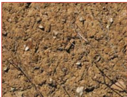
Couleur et texture de la bauge.