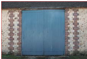
Déclinaison de différents bleus pour les volets et portes.