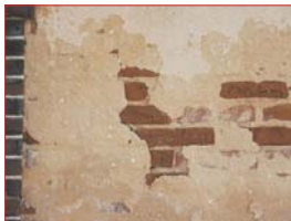
Ancien enduit ocre rouge et brique.