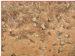
Enduit à pierre vue ocre.