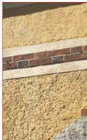
Enduit couvrant ocre-jaune et brique.