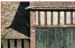
Colombages protégés par un lait de chaux.