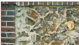
Maçonnerie de brique et silex.