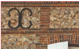
Maçonnerie de brique et silex.