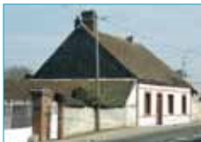
Maisons de village à la sortie du bourg de Laons.