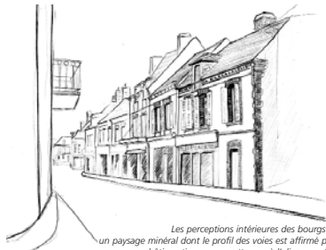
Les perceptions intérieures des bourgs de plaine : un paysage minéral dont le profil des voies est affirmé par un front bâti continu, mur gouttereau à l'alignement de la voie.

On trouve deux types majeurs de composition, la maison en pan de bois ou colombage et la maison en maçonnerie.