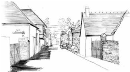
Les perceptions intérieures d'un village de vallée : une succession de toits et de murs, murs pignons et murs gouttereaux, avec à l'arrière plan le coteau boisé.