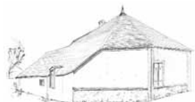
Corps de bâtiment principal d'une ferme depuis la rue. Maillebois. Le toit asymétrique descend très bas, pour couvrir l'annexe.