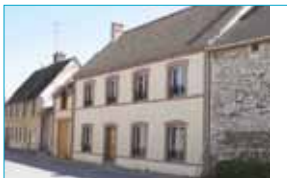
Maisons dans les bourgs :