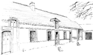
Bâtiment d'habitation d'une ferme, ouvert sur la cour. Maillebois. Les volumes de ces bâtiments sont des parallélépipèdes allongés. Les travées ne sont pas forcément réparties régulièrement. Les baies sont souvent légèrement cintrées. Une lucarne engagée dans le mur, permet l'accès au grenier.

Elles sont constituées au minimum par trois ou quatre bâtiments implantés autour d'une cour centrale : corps de logis, granges, étables... Dans la cour, se trouvent fréquemment puits, mare et/ou colombier. Sur rue, les bâtiments alignent leur mur gouttereau, le plus souvent aveugle. Les fermes fortifiées adoptent la même disposition. Elles étaient entourées de douves qui ont été, dans la quasi totalité des cas, remblayées. Un potager et un verger sont situés sur l'arrière de la parcelle. L'accès depuis la rue se fait par un portail encadré par deux piliers en brique. Le portail était à l'origine couvert et coffé de tuiles plates comme le mur de clôture.