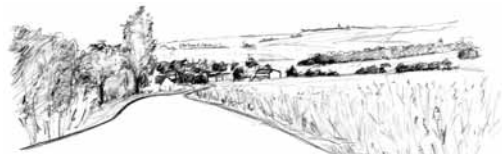
Les perceptions extérieures d'un village de vallée : les toits émergent, nichés dans la pente et la végétation.