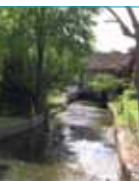
Mares, ruisseaux, rus ponctuent le paysage du Pays Drouais.