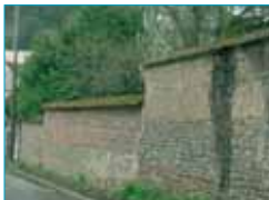
Les hauts murs de clôture maçonnés referment l'espace rue.