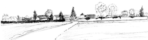
Les perceptions lointaines des villages de plaine : un premier plan arboré et ceint de murs en maçonnerie, qui laisse deviner les toitures.

Dans la plaine, le réseau des voies organise les villes et villages de tailles diverses et dispersés. Ils présentent deux types d'implantation : les implantations à la croisée des chemins, de taille conséquente, ou les villages-rues, dont les bourgs sont de taille réduite.