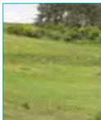
Bosquets et alignements d'arbres animent le paysage.