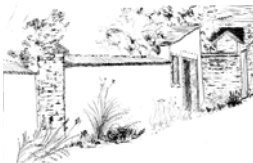
L'alternance de murets, maisons, annexes et éléments végétaux est caractéristique du paysage des rues.