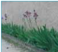
Iris au pied des murs de clôture.

C - clôture composée d'un muret surmonté d'un grillage et doublé d'une haie, les piliers encadrent le portail, D - clôture végétale en milieu agricole.