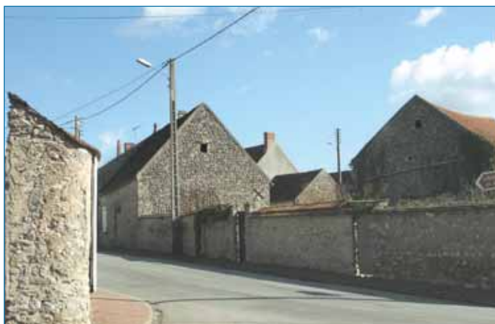
Maisons de village en alternance avec des murs maçonnés. Saint-Léger-des-Aubées.