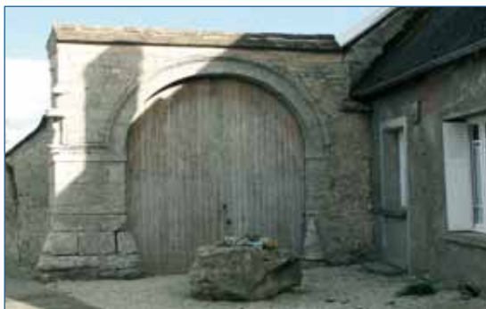
Ferme à cour fermée : porche d'entrée et grange sur rue. Prasville.