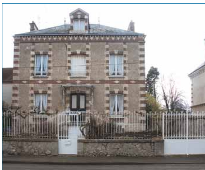
Maison fin XIX ème début XX ème , en retrait de l'alignement* et en retrait des limites de propriété. Auneau.

La maison de village, à la base, est un volume simple, plus long que haut. Ce volume est généralement composé d'un rez-de-chaussée, parfois surmonté de combles aménageables. Exceptionnellement, le rez-de-chaussée est surmonté d'un étage avec ou sans combles aménageables. Sa façade sur rue est constituée de trois à six ou sept travées de baies. La façade n'est pas ordonnancée*.