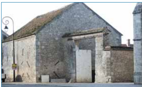
Porche d'accès à la cour fermée d'une ferme. Ouarville.