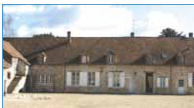
Façade du corps de logis d'une ferme. Béville-le-Comte.