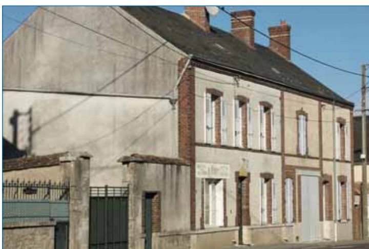
Maisons d'habitation avec porche ou clôture permettant d'accéder à la cour en arrière de parcelle. Orgères-en-Beauce.