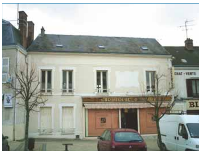
Maison de commerçant. La devanture commerciale s'inscrit bien dans l'ordonnement* de la façade. Auneau.